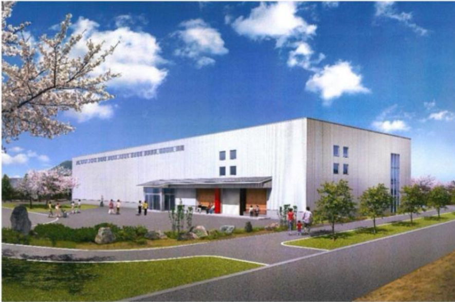
(外観イメージパース)